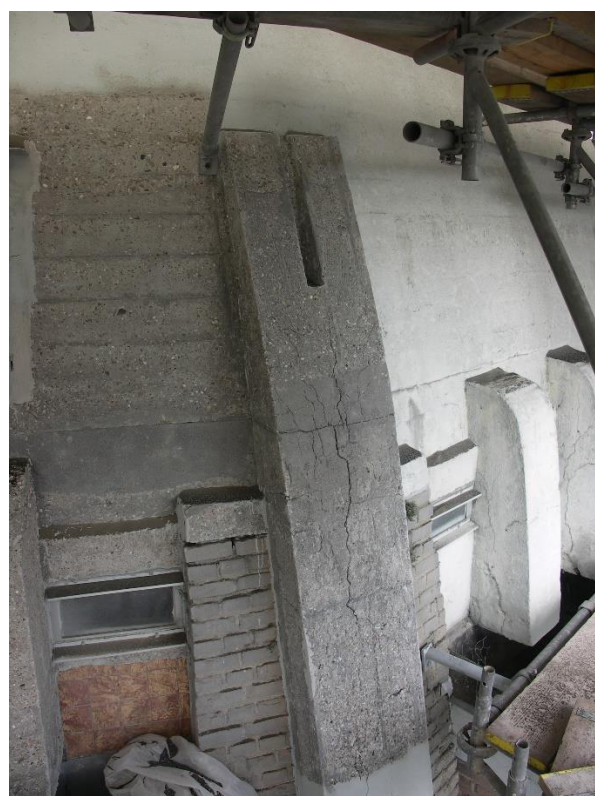
Afb. Watertoren Zutphen. (Foto Michiel van Hunen, 2005)

Het verbeteren van (onderdelen van) monumenten is alleen van toepassing als een gebruikersdoel (bijvoorbeeld eisen die voortvloeien uit veilig gebruik van een monument of verduurzaming) hierom vraagt en op voorwaarde dat de waardestelling hiervoor de ruimte geeft.