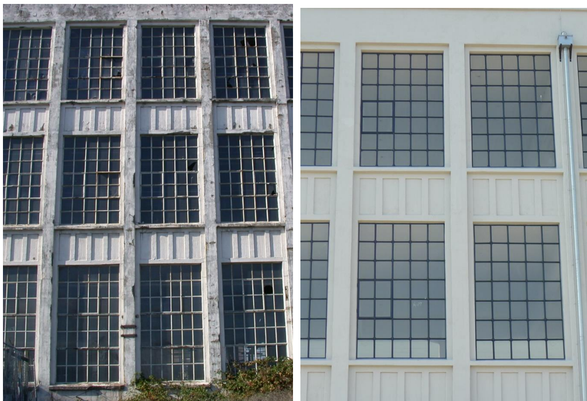
Afb. Timmerfabriek Vlissingen voor (2004) en na (2011) renovatie.

Bij historisch beton kan de kleur door wisselingen in samenstelling per locatie en zelfs binnen een gevelvlak sterk verschillen. Het betonrestauratiebedrijf houdt hiermee rekening bij de proefvlakken/referentievlakken.