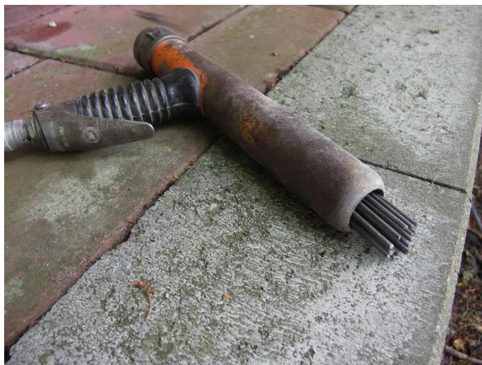
Afb. Naaldbikhamer.