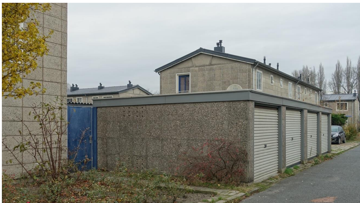
Afb. Airey-woningen in de Jeruzalembuurt te Amersfoort

Op de afbeelding hieronder staan Aireywoningen en garages in de Jeruzalembuurt te Amersfoort (Bergheof 1949-1950). Bij de waardering van de betongereleerde aspecten van deze woonwijk is het beschouwingsniveau 'ensemble' van groot belang. Het Airey-systeem van geprefabriceerde kleine betonelementjes is hier van invloed geweest op de hele stedenbouwkundige opzet van deze wijk, de maatvoering en de plaatsing van de blokken met woningen. De modulariteit van het systeem is van belang en de algehele zachte kleurtoon wordt bepaald door het schone-grindbeton. De matrix kan behulpzaam zijn bij het aangeven van de waarden juist op het hoge schaalniveau en wellicht veel minder op het schaalniveau van de betonsamenstelling.