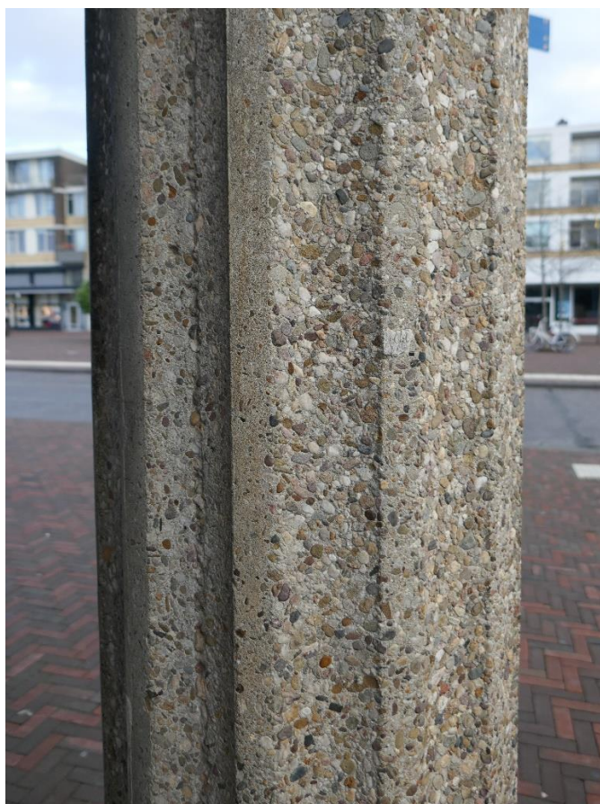
Afb. Textuur Stationsgebouw Hengelo.