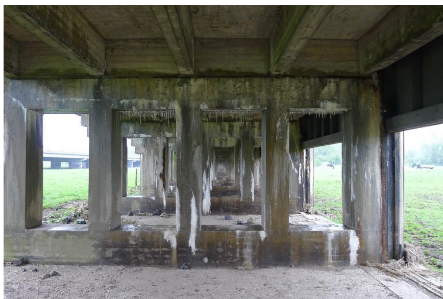
Afb. Schade doorlaatbrug Eldensedijk – Arnhem.