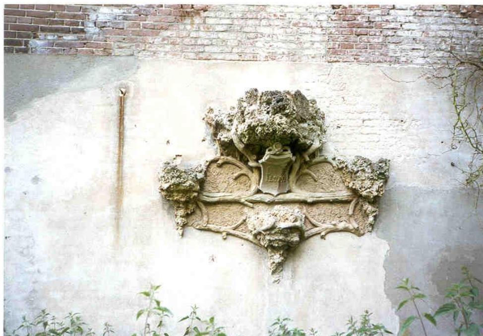
Afb. Betonnen vijver met gele afdeksteen in de tuin van Warnsborn bij Arnhem (verdiepte delen bestemd voor de groei van waterplanten, foto: Eric Blok).

In een volgende versie van deze URL zal deze bijlage nader worden uitgewerkt.